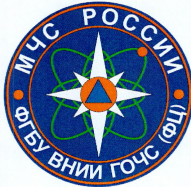
Рисунок большой эмблемы «ФГБУ ВНИИ ГОЧС (ФЦ)»:

5.1.3. Эмблема «Федерального центра науки и высоких технологий» (далее – ФЦНВТ) имеет форму круга белого цвета, окаймленного кольцом синего цвета. Внутри кольца по кругу размещаются надписи черного цвета, расположенные сверху и снизу, разделенные кругами синего цвета. В верхнем полукруге размещена надпись «ФГБУ ВНИИ ГОЧС (ФЦ)», внизу – «ФЕДЕРАЛЬНЫЙ ЦЕНТР НАУКИ И ВЫСОКИХ ТЕХНОЛОГИЙ». В центре эмблемы размещен синий равносторонний треугольник с основанием внизу, вписанный в оранжевый круг. Вокруг круга равномерно размещены четыре орбиты электронов с двумя электронами синего цвета на каждой орбите.